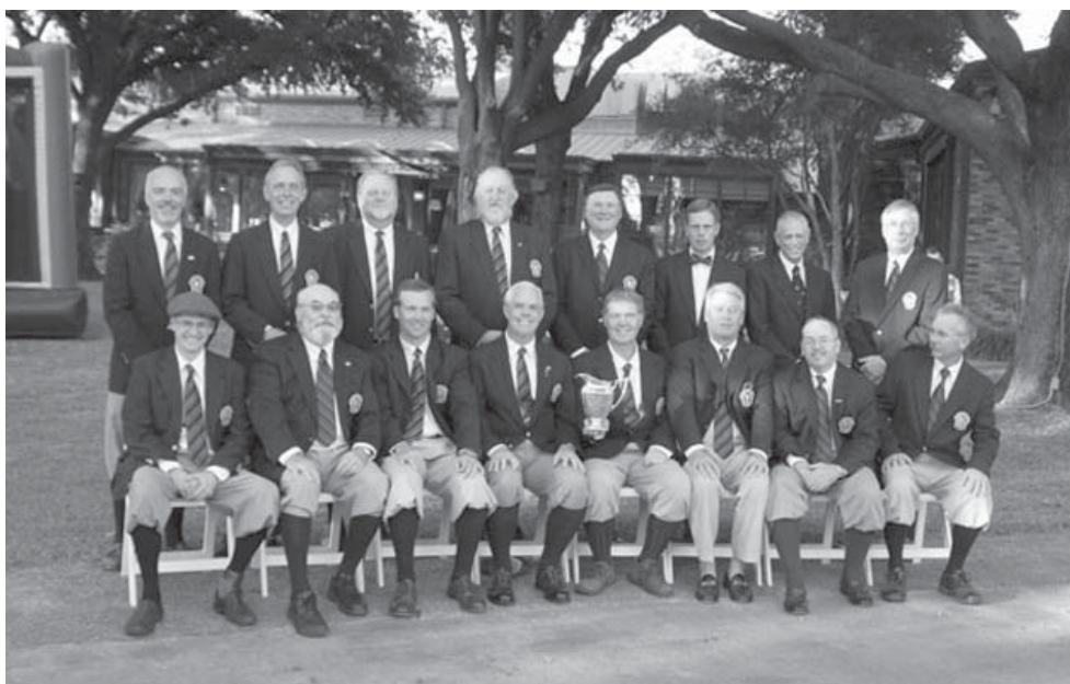
USA:n Hickory Grail joukkue 2007, kuva Ralph Livingston.