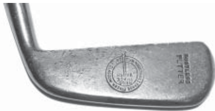
Kuvassa 1922-1926 Glasgowssa valmistettu Range Finder -putteri.

Keräillä voi siis lähes mitä tahansa, aina ilmaiseksi jaettavista tulokorteista satoja tuhansia maksaviin antiikkisiin harvinaisuuksiin. Keräillä voi myös monella eri tavalla, esim. keskittymällä kärsivällisesti kapeampaan alueeseen tai periaatteella vähän sitä ja tätä