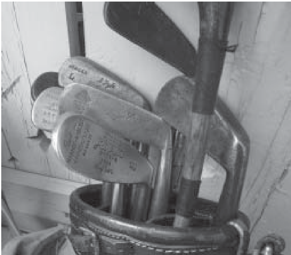
Asianmukaisia välineitä

Historian vaalimiseen kuuluu eittämättä myös lajin vanhojen tapojen elvyttäminen, joista mielenkiintoisin on luonnollisesti vanhoilla mailoilla pelaaminen. Jo viime syksynä pelasimme, Suomen vanhimmalla kentällä Talissa, kaikkien aikojen ensimmäiset yhdistyksemme mestaruuskilpailut, jossa pelivälineinä olivat luonnollisesti, ennen vuotta 1935 rakennetut hikkorivartiset mailat. Myös pelaajien asusteet noudattivat 1900-luvun alkuvuosien muotia.