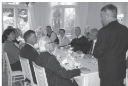
Juhlapäivällinen Talin klubitalolla.