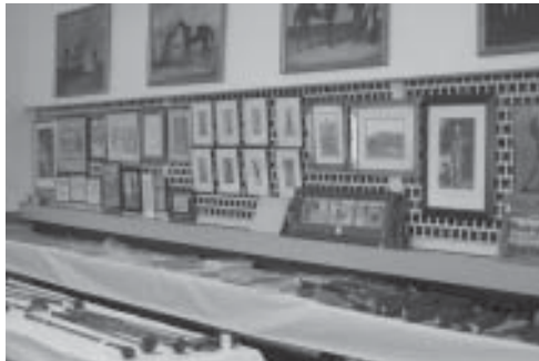
Kuvassa keräilykohteita Englantilaisessa huutokaupassa.

Kuten varmasti olet jo päätellyt, kaikkea golfiin liittyvää voi keräillä ja lähes aina maailmasta löytyy joku samasta aihealueesta kiinnostunut. Lopuksi voitaisiin vielä mainita seuraavat keräilyn kohteet: pelit/leikkikalut, lehdet, kentän hoitovälineet, kirjeet ja kirjepaperi, erilaiset etiketit (esim. tupakka, olut, jne.), valokuvat, kilpailuohjelmat, julisteet, laulut / levyt, tiettyyn kilpailuun liittyvät esineet (Ryder Cup, Masters, Openit), jne.