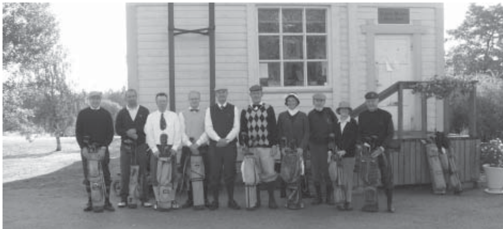
SM -kisat Talissa 23.9.2007, osa pelaajista valmiina taistoon.