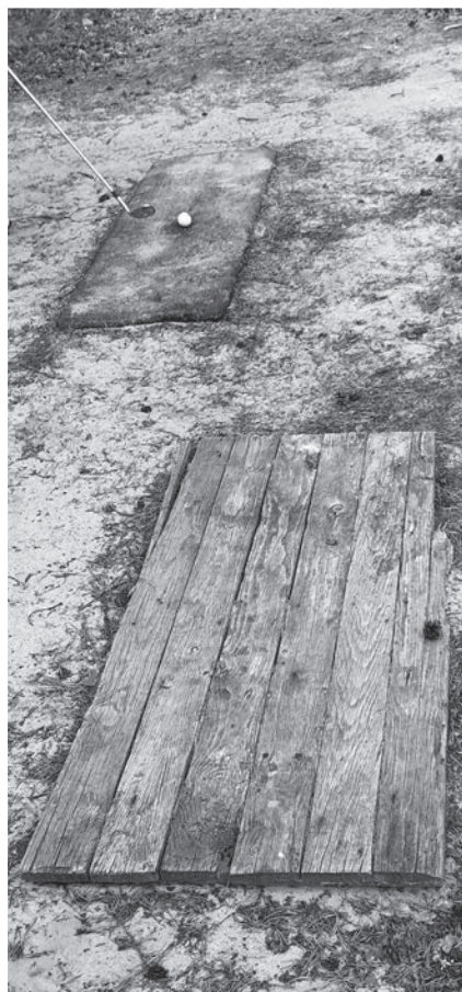
Nykyisen kentän toinen ”griini” ja selkeät opasteet.

teri Beach lomakeskuksesta ( www.yyteribeach.fi ).