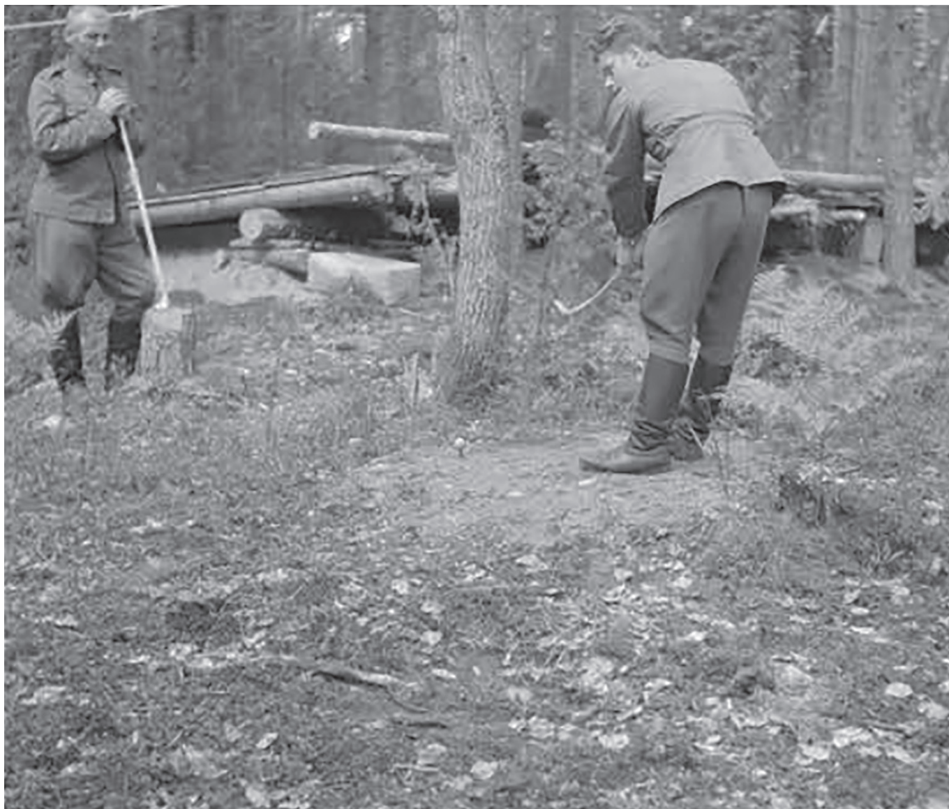
SA KUVA 1942

Golfin harrastaminen alkoi Suomessa suuremmissa mittakaavassa 1930-luvulla. Nopeasti tämän jälkeen maamme olikin jo sotatilassa. 1940-luvun alussa Suomessa oli kuitenkin jo useita satoja aktiivisia golffareita. Sodan aikana kotirintamalla oli golfin saralla hyvin hiljaisinta. Muutamat olemassa olevat kentät olivat suurilta osin muussa käytössä, mm. viljelysmaina.